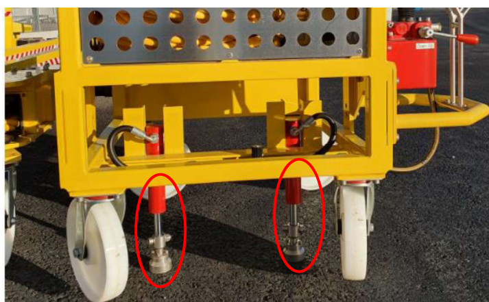
Stödbenen som lyfter kabelkorgen