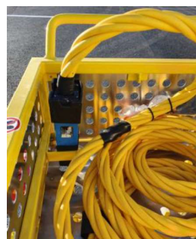
Anslutningskabeln i kabelkorgen

Swedavia Felanmälan 010-109 66 00 Snabb: 039 6600