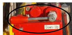
Sänk kabelkorgen med Down