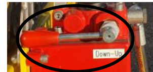
Sänk kabelkorgen med Down