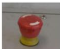
Emergency Stop Button