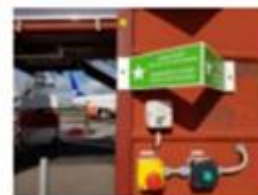
Location at Ramp