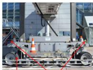
Drive Unit Emergency Stop Buttons